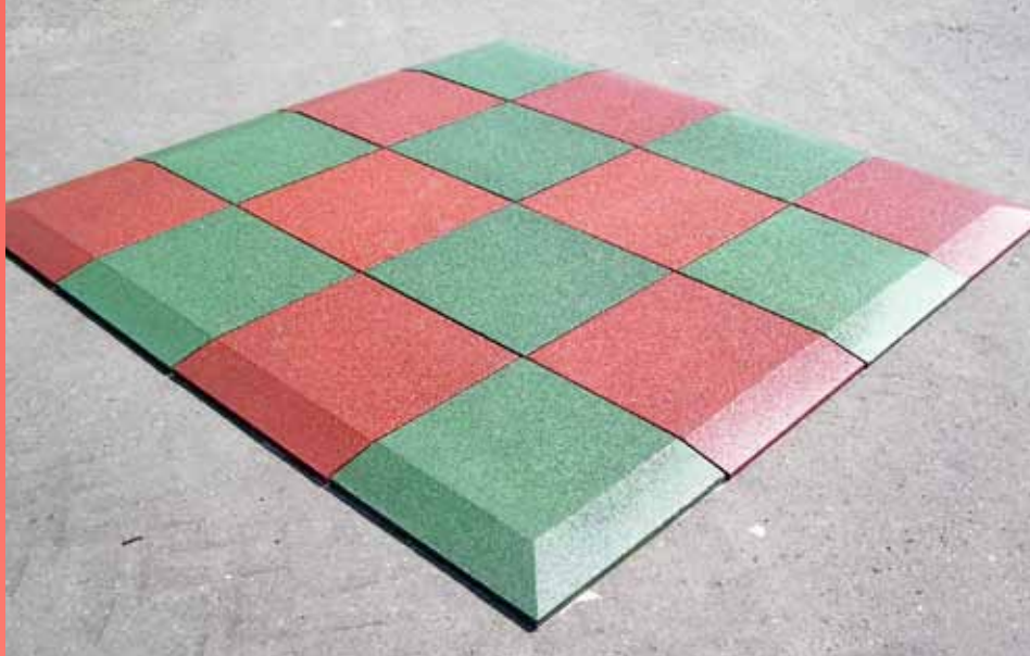
IDA se zkosením

Protipádová dlažba IDA se vyrábí v různých profilech, rovná či se zkosením. Z povrchově obarveného granulátu, nebo s EPDM vrstvou z celoprobarveného granulátu. Jednotlivé desky je možno lepit nebo pojit pomocí kolíků, které jsou součástí dodávky.